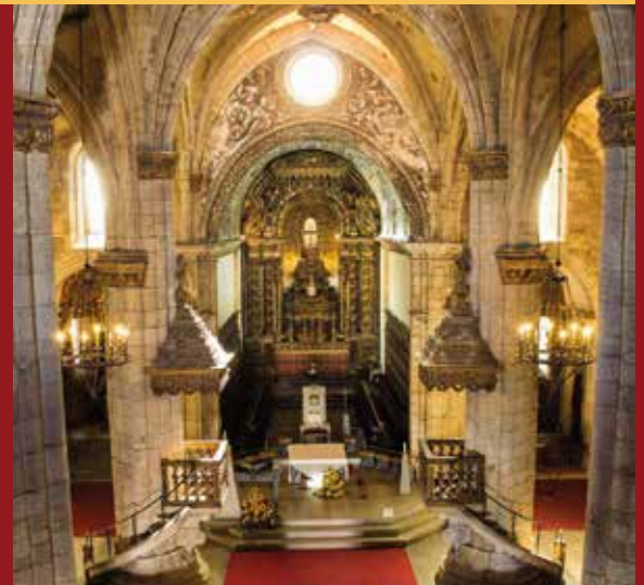
Sé de Viseu