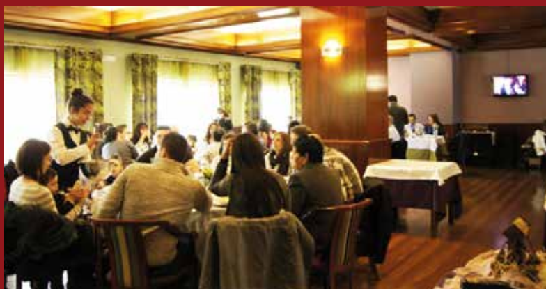
Restaurante do Hotel

Reservas: 00 351 232 381 154 • E-mail: reservasmontemuro@gmail.com