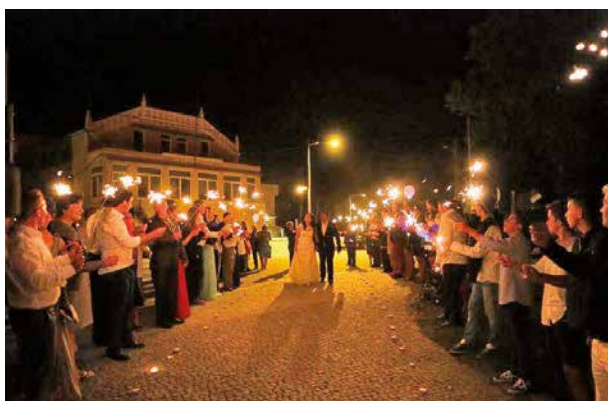
Casamento no Jardim do Hotel Montemuro