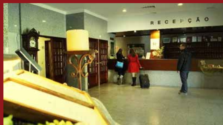
Recepção do Hotel