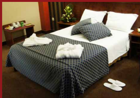
Quarto de Casal