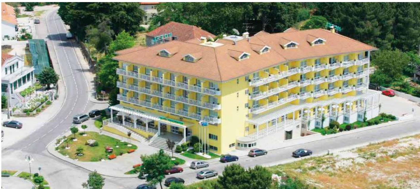
Vista aérea do Hotel Montemuro