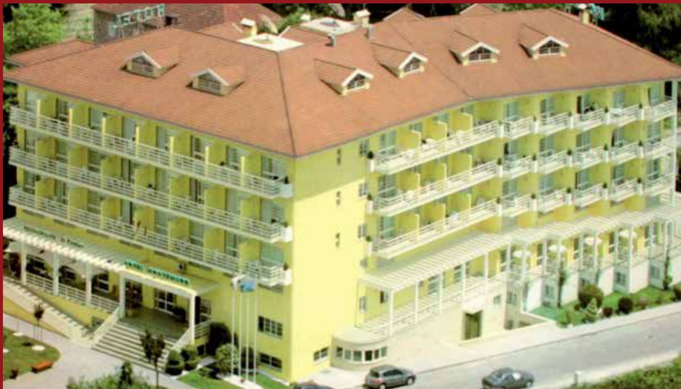
Fachada Principal do Hotel Montemuro