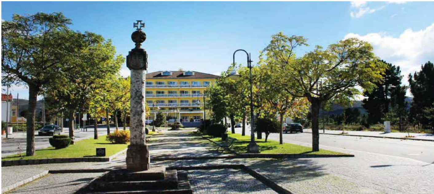
Fachada Principal virada para a Avenida das Termas do Carvalho