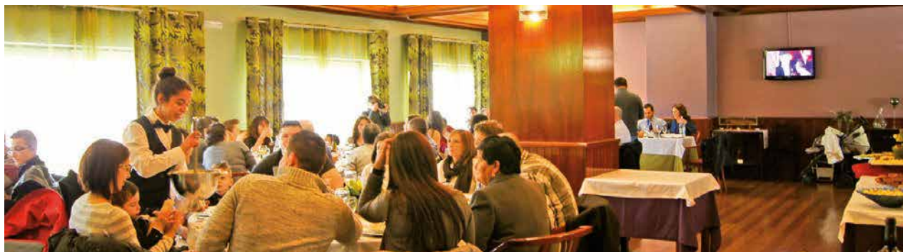
Parte da Sala do Restaurante do Hotel Montemuro