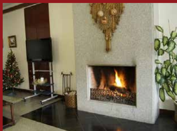
Lareira Sala de Estar e Bar do Hotel