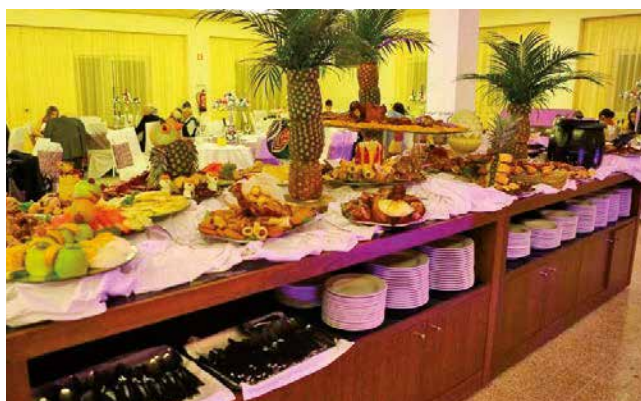
Buffet de Sobremesas Hotel Montemuro