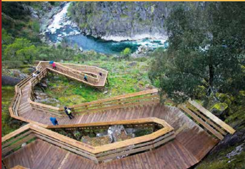
Passadiços do Paiva